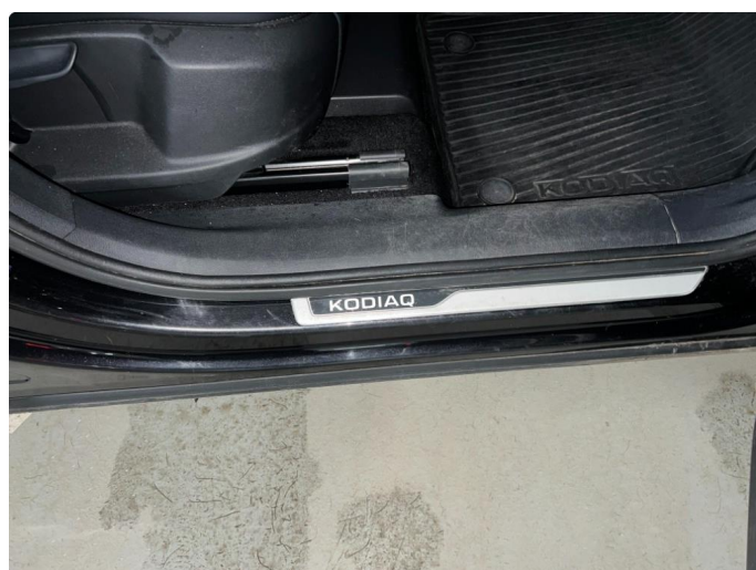
1.1 Sår/riper rundt om på bil. Bedre en normalt med tanke på år/km.