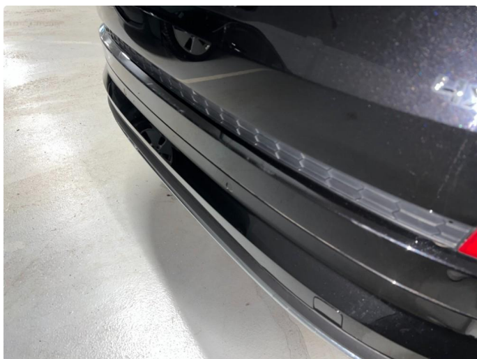
1.1 Sår/riper rundt om på bil. Bedre en normalt med tanke på år/km.