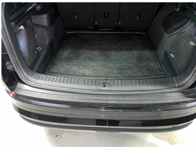
1.1 Sår/riper rundt om på bil. Bedre en normalt med tanke på år/km.