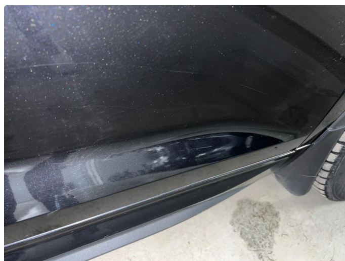
1.1 Sår/riper rundt om på bil. Bedre en normalt med tanke på år/km.