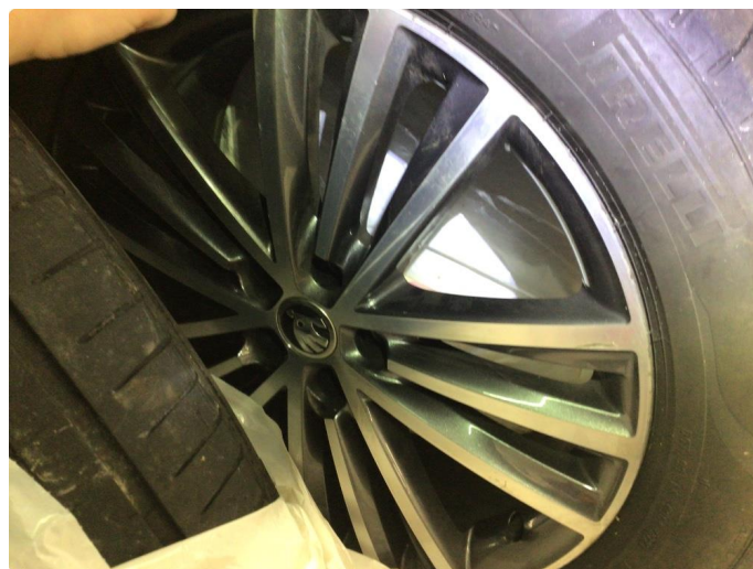
1.3 Noe kantkjørte sommerfelger, ikke veldig mye