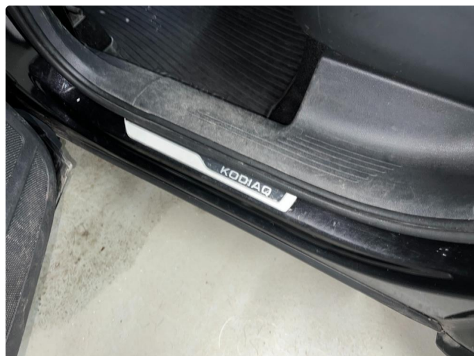
1.1 Sår/riper rundt om på bil. Bedre en normalt med tanke på år/km.