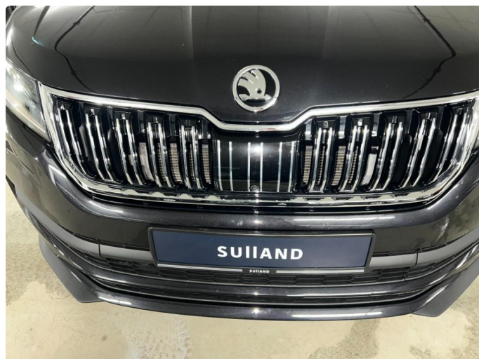
1.1 Sår/riper rundt om på bil. Bedre en normalt med tanke på år/km.