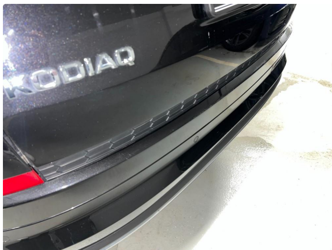
1.1 Sår/riper rundt om på bil. Bedre en normalt med tanke på år/km.