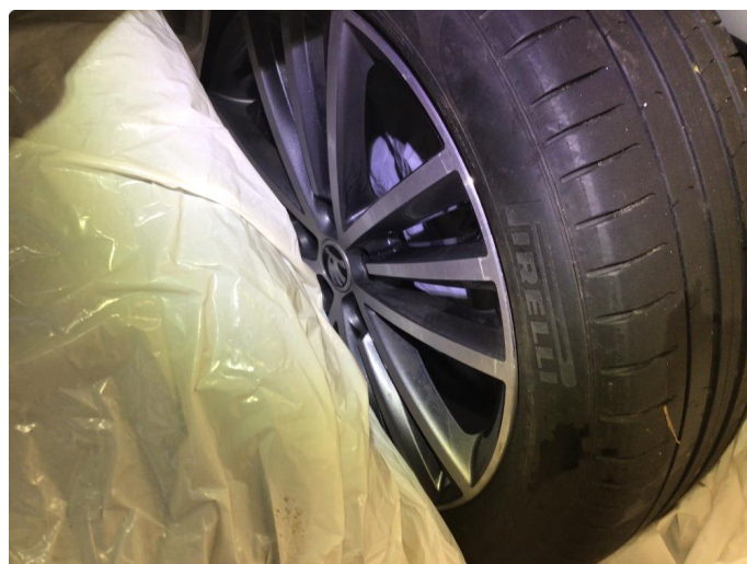
1.3 Noe kantkjørte sommerfelger, ikke veldig mye