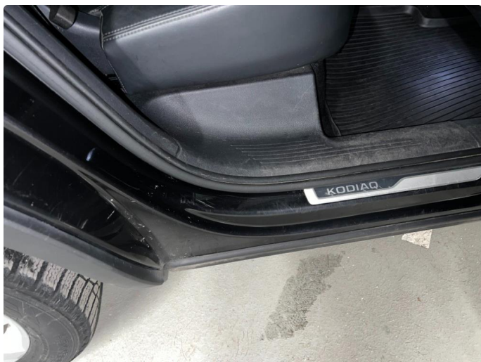
1.1 Sår/riper rundt om på bil. Bedre en normalt med tanke på år/km.