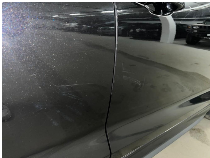
1.1 Sår/riper rundt om på bil. Bedre en normalt med tanke på år/km.