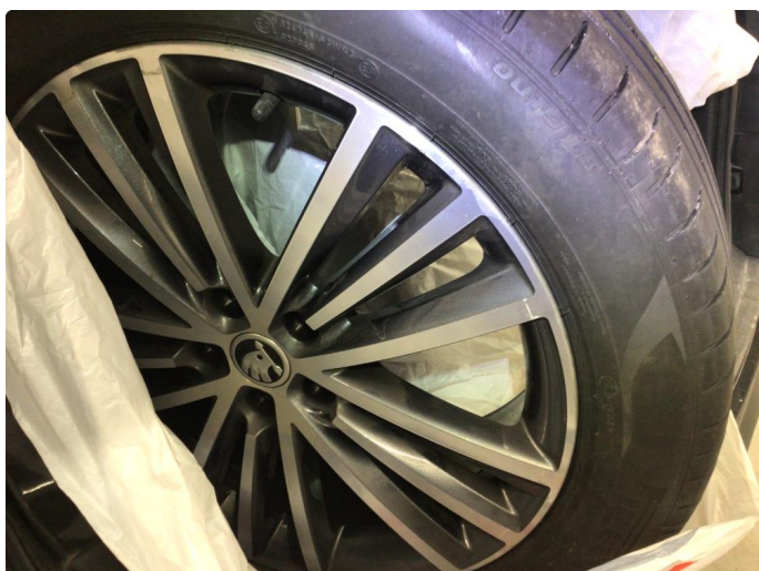
1.3 Noe kantkjørte sommerfelger, ikke veldig mye