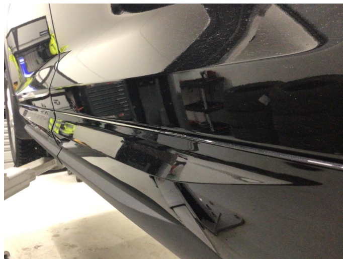
1.2 Lakk flasser av fra dørlist nede på dør