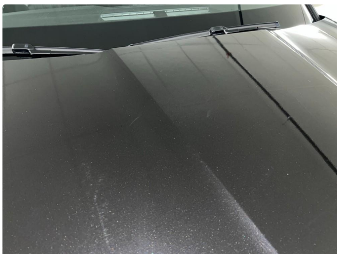
1.1 Sår/riper rundt om på bil. Bedre en normalt med tanke på år/km.