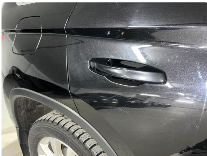
1.1 Sår/riper rundt om på bil. Bedre en normalt med tanke på år/km.