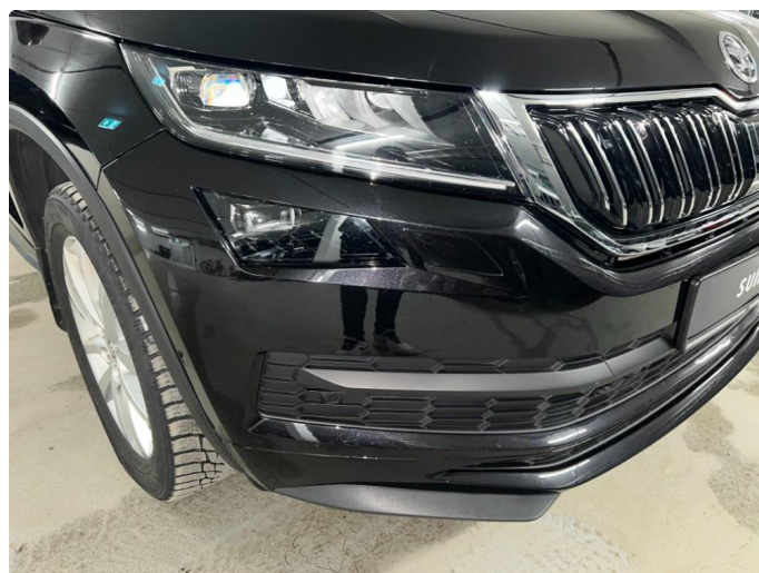
1.1 Sår/riper rundt om på bil. Bedre en normalt med tanke på år/km.