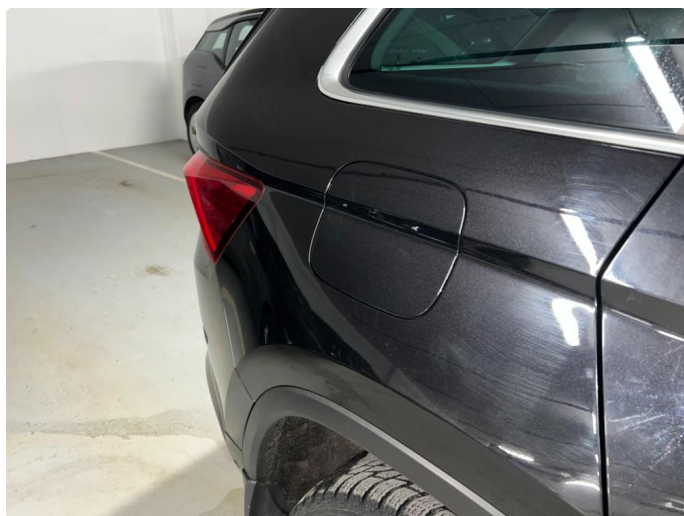
1.1 Sår/riper rundt om på bil. Bedre en normalt med tanke på år/km.