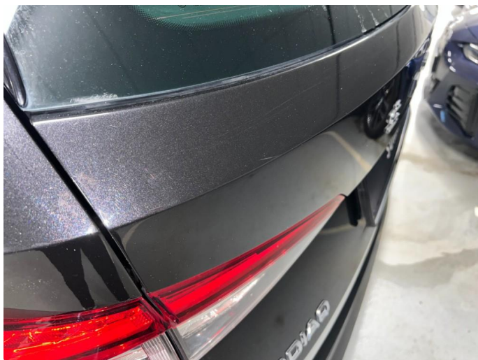
1.1 Sår/riper rundt om på bil. Bedre en normalt med tanke på år/km.