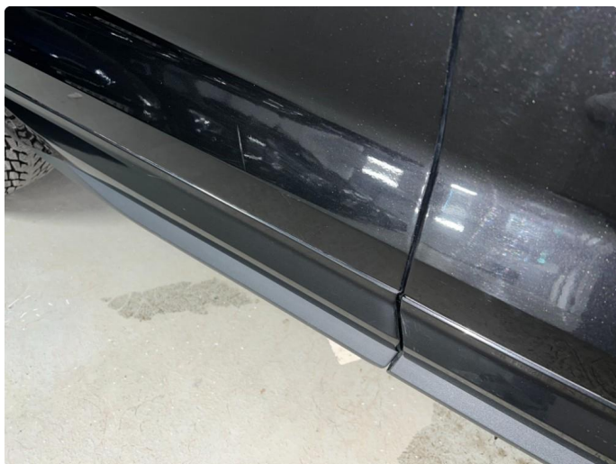
1.1 Sår/riper rundt om på bil. Bedre en normalt med tanke på år/km.