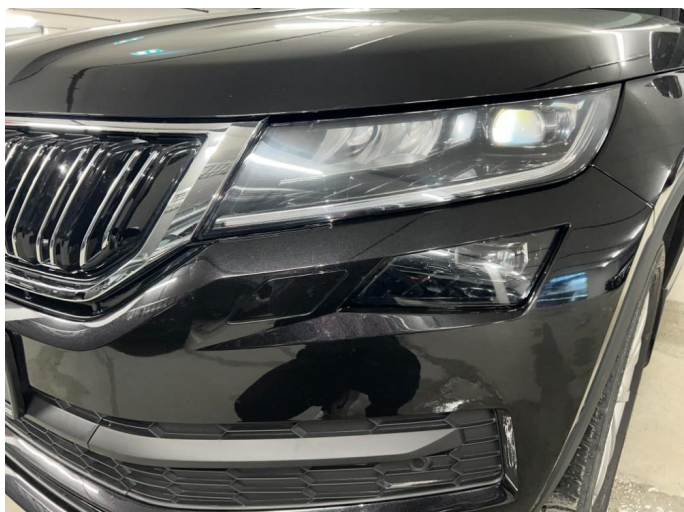
1.1 Sår/riper rundt om på bil. Bedre en normalt med tanke på år/km.