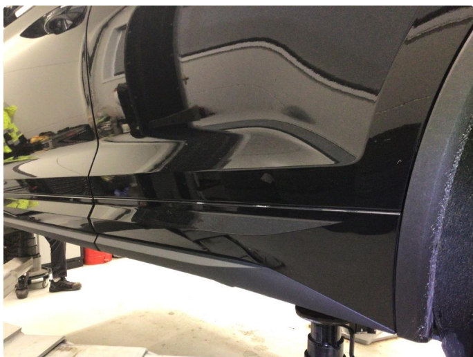
1.2 Lakk flasser av fra dørlist nede på dør