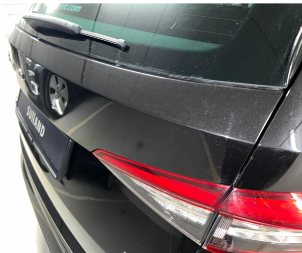
1.1 Sår/riper rundt om på bil. Bedre en normalt med tanke på år/km.