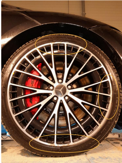
1.1 Bruksmerke på felg