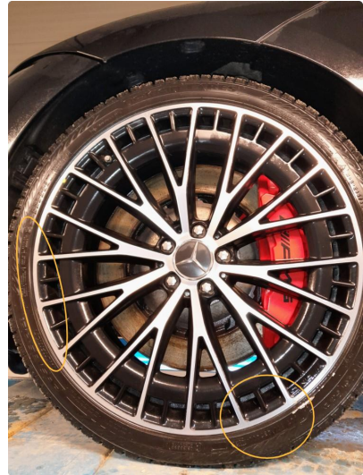
1.1 Bruksmerke på felg