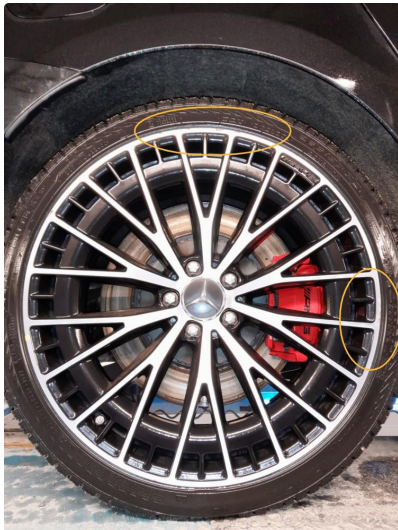
1.1 Bruksmerke på felg