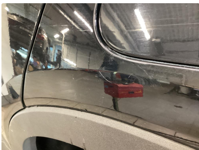
1.2 Små bruksmerker, normalt ihht alder/km.stand.