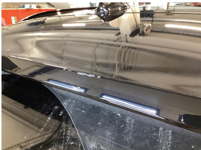
1.1 Små bruksmerker, normalt ihht alder/km.stand.