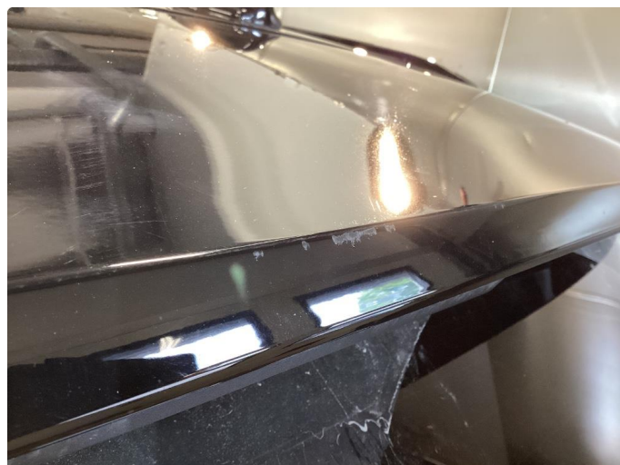
1.1 Små bruksmerker, normalt ihht alder/km.stand.