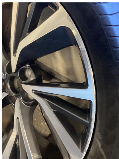
1.1 Noen små merker på felger