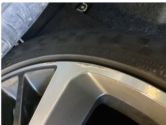
1.1 Noen små merker på felger