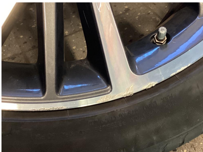
1.1 Noen små merker på felger