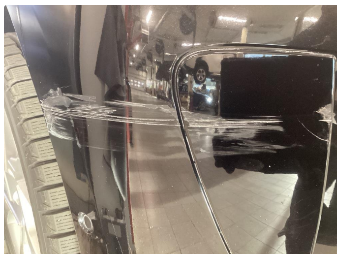
1.2 Riper støtfanger