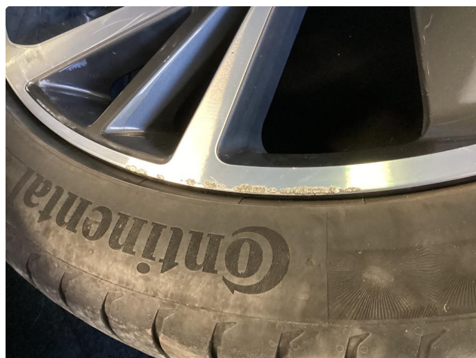
1.1 Noen små merker på felger