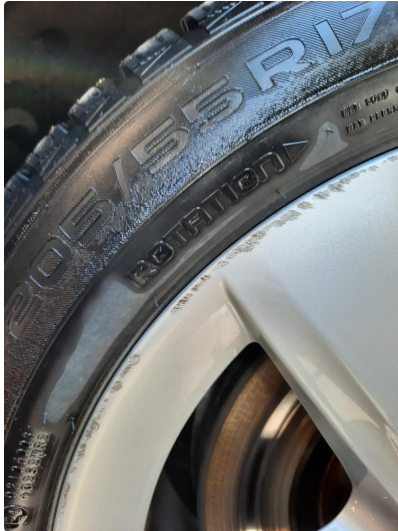
1.1 Kantkjørt felg