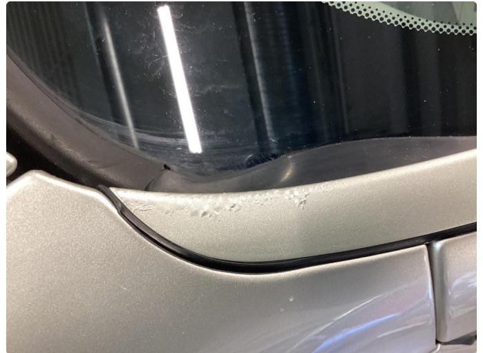
1.2 Korrosjon ved A-stolpe deksel nede