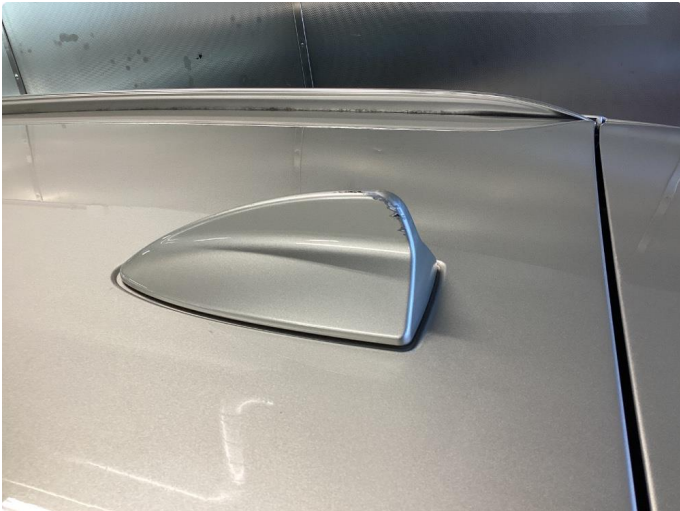
1.1 Ripe haifinne