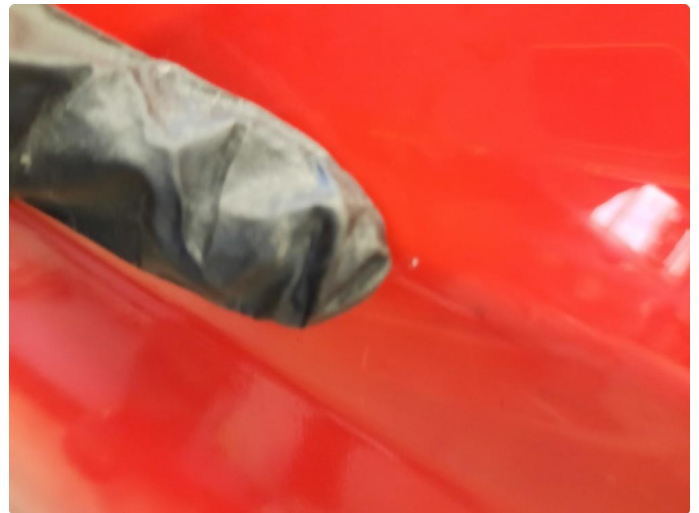
1.2 Noe steinsprut