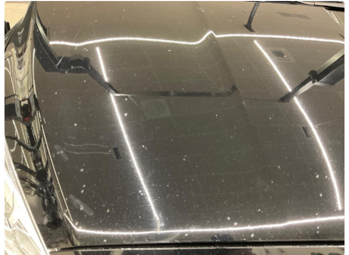
1.1 Noe steinsprang panser