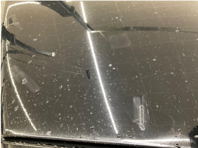
1.1 Noe steinsprang panser