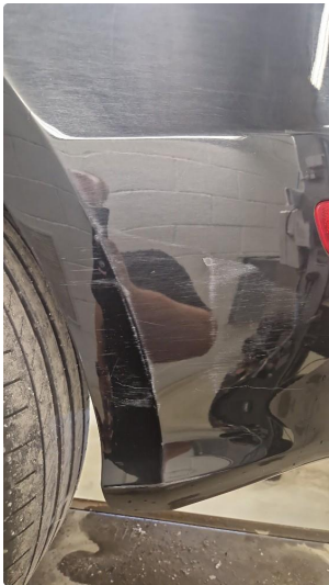
1.3 Ripe(r) ned til grunning