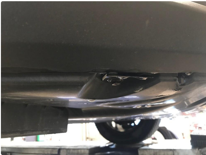
1.2 Spoilerlist defekt