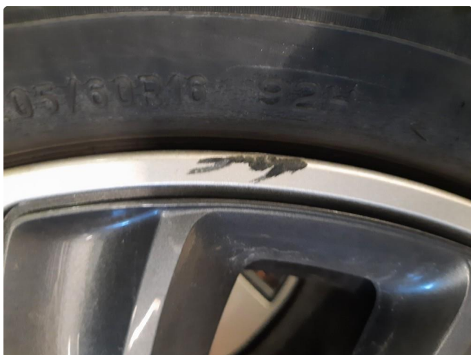
1.3 Merker på felg