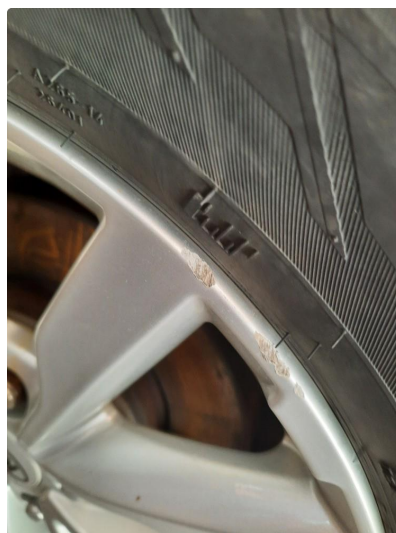
1.3 Merker på felg