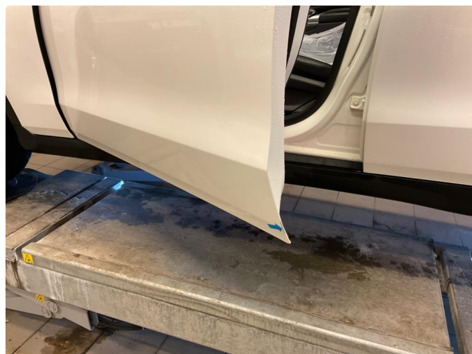
1.2 Ripe ned til grunning