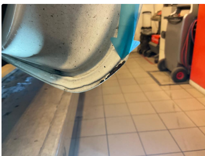
1.3 Lakk flasser