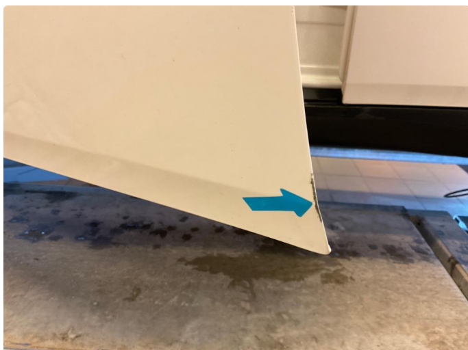
1.2 Ripe ned til grunning