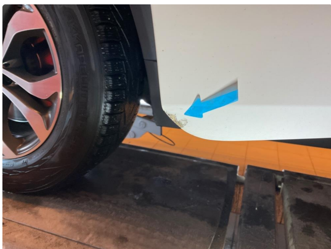
1.3 Lakk flasser