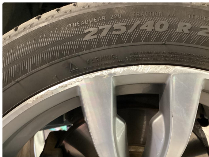
1.2 Kantkjørt felg