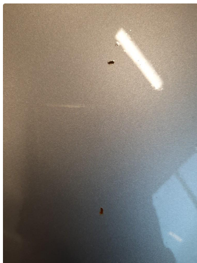
1.1 Noe steinsprut med rust