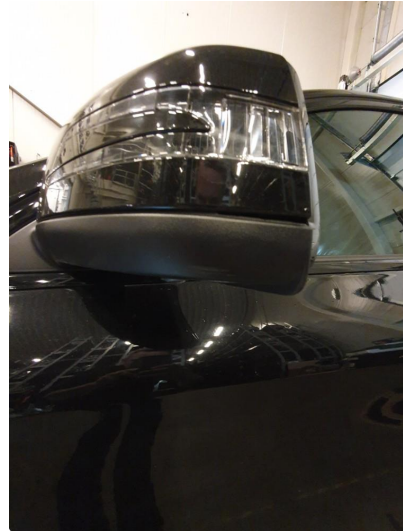
1.2 Deksel skadet/ripe