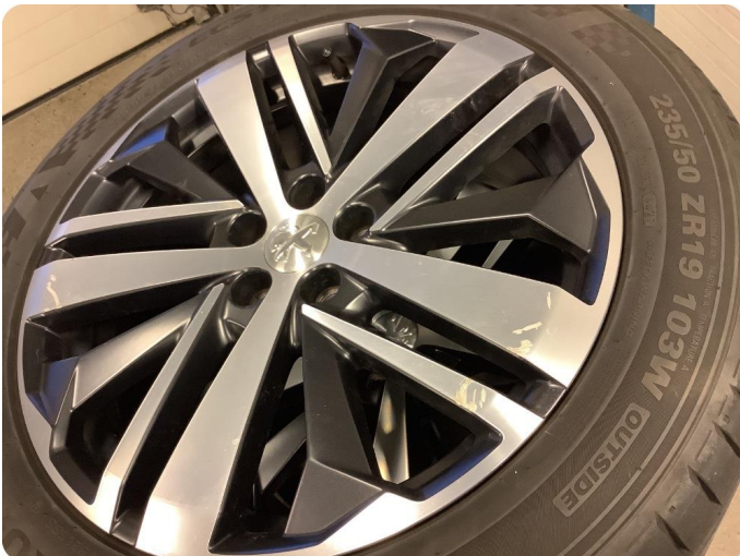
2.2 Kantkjørt felg Kantkjørt felg, 1 stk sommerdekk