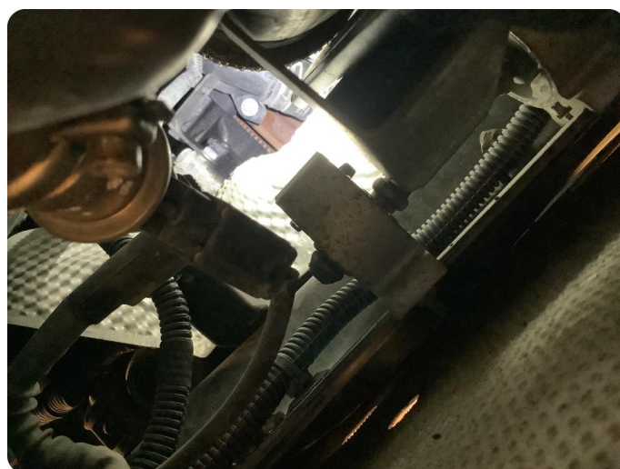
4.1 Svetter Oljelekkasje /svetting fra dieselpumpe (skifte av dieselpumpe) ?