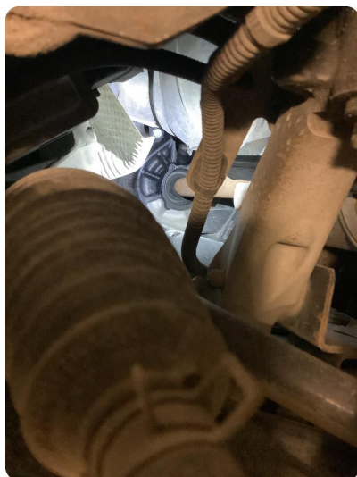
4.1 Svetter Oljelekkasje /svetting fra dieselpumpe (skifte av dieselpumpe) ?