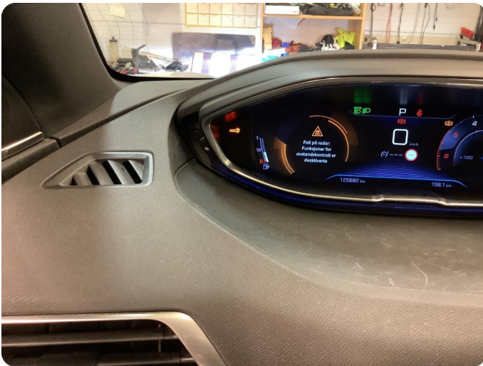
1.1 Varsellampe lyser se bilde (Feil på radar)