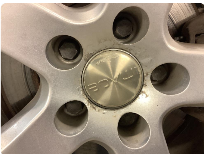
2.3 Betydelig oksidering Litt oksidering på alle felger (vinterdekk)