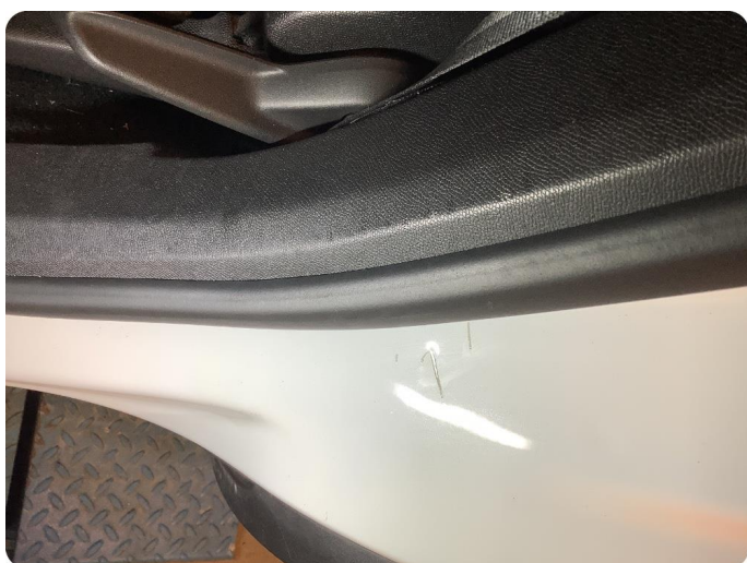
2.5 Noen riper og småbulker Dype riper med små bulker (døråpning venstre bakkdør)