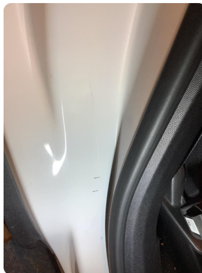
2.4 Noen riper og småbulker Noen små bulker, (og dype riper).døråpning høyre bakkdør