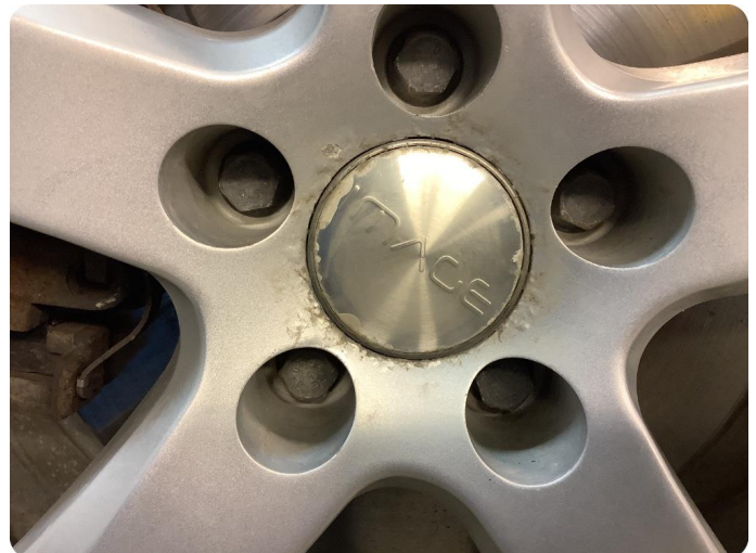
2.3 Betydelig oksidering Litt oksidering på alle felger (vinterdekk)