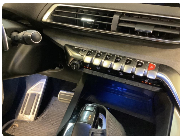
5.1 Varmelement virker ikke Feil på varmefunksjon (ingen varme), i førersete