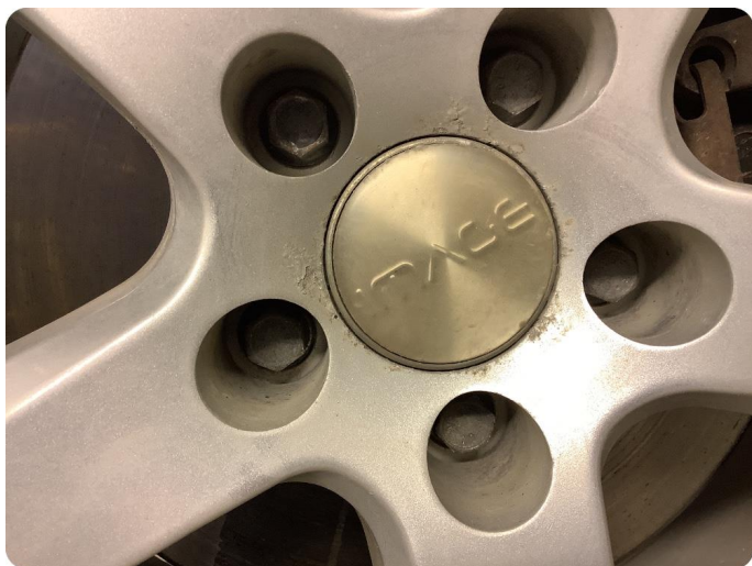
2.3 Betydelig oksidering Litt oksidering på alle felger (vinterdekk)