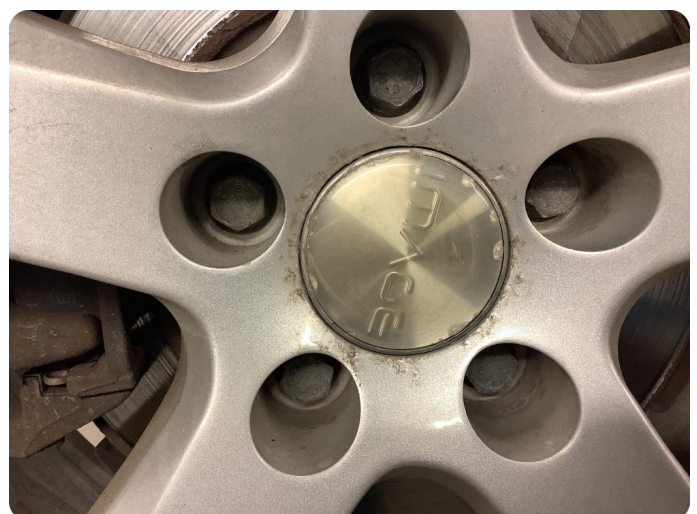
2.3 Betydelig oksidering Litt oksidering på alle felger (vinterdekk)