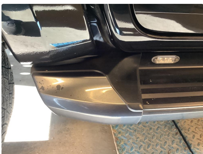
1.4 Øvrige feil