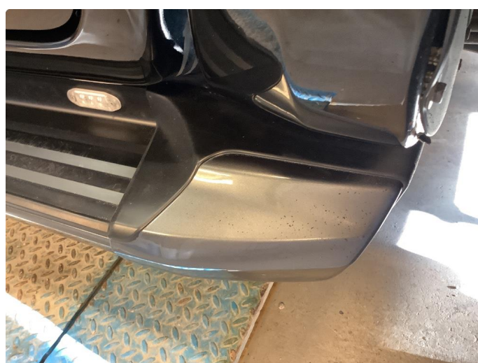
1.5 Øvrige feil