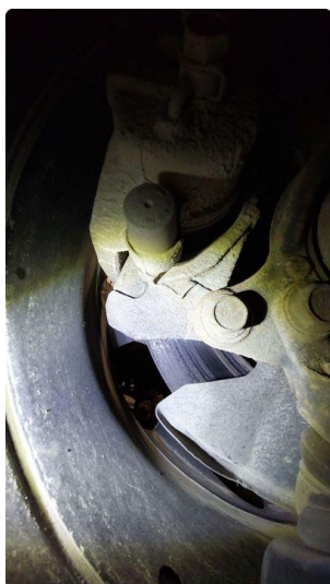
2.1 Mer enn 25% rust