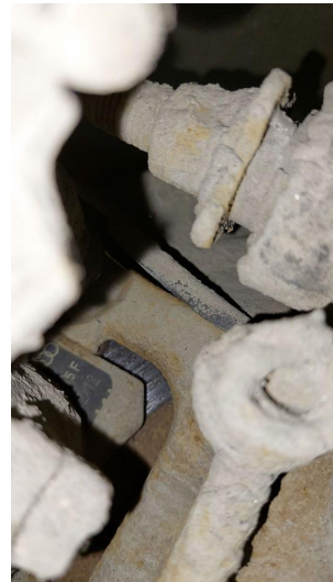
4.1 Mer enn 25% rust