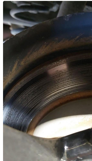
4.1 Mer enn 25% rust