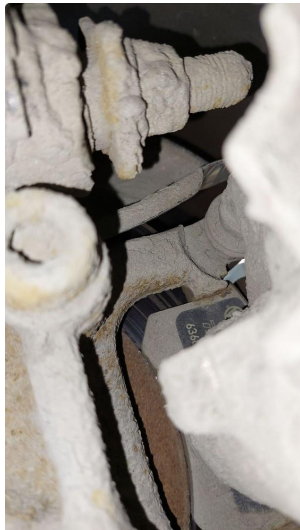
4.1 Mer enn 25% rust