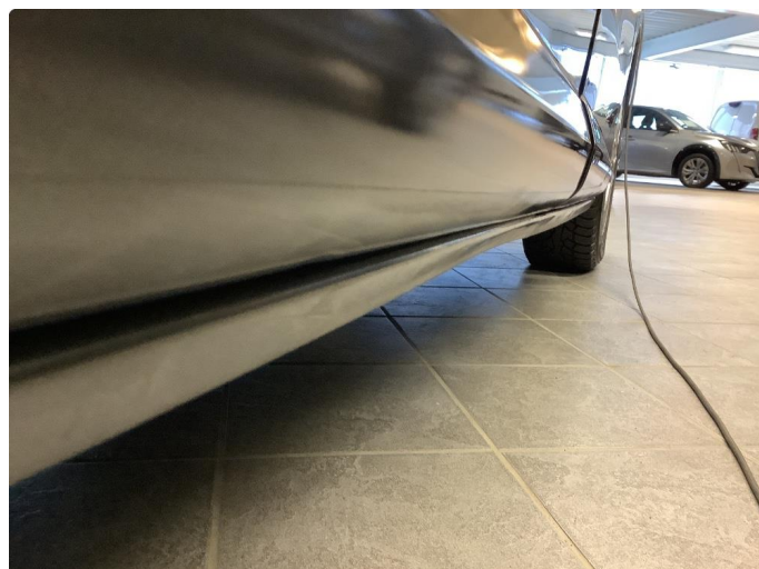
1.2 Bulk i kanal h.side.