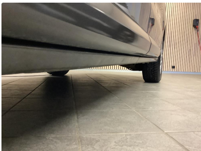
1.3 Flere små bulker i kanal v.s