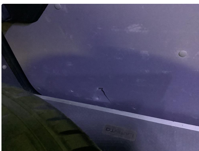
2.2 Skade på plast deksel på høyre skyvedør, innvendig i varerom