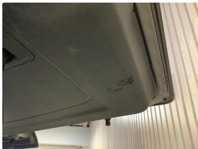
2.1 Skraper i deksel på bakluke, innvendig