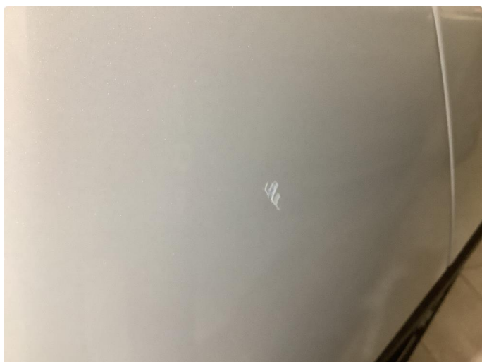
1.3 Skade i lakk, h.side støtfanger bak