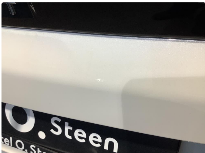
1.1 Lite sår i lakk på bakluke