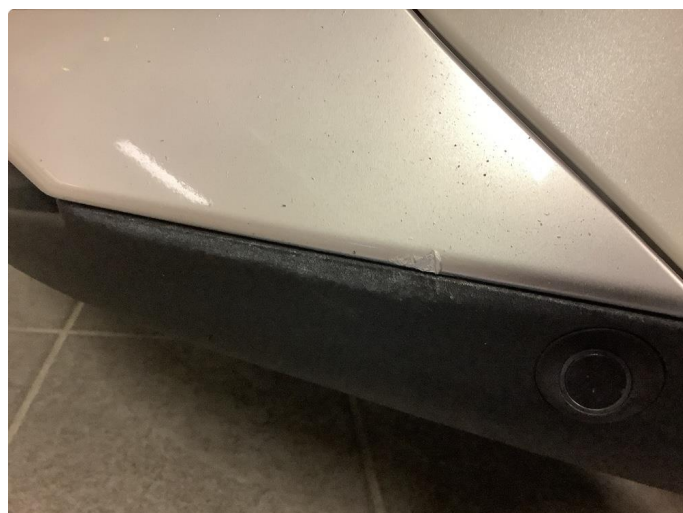
1.4 Skramme i plastikk v.s foran nede