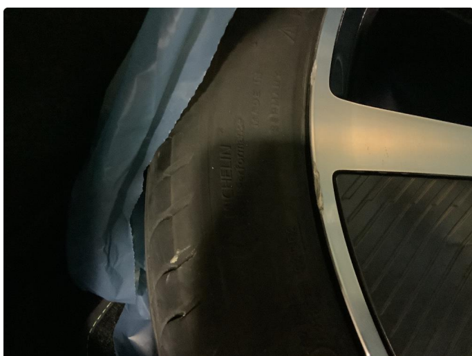
1.2 To sommer felger har mindre kant kjøring skade