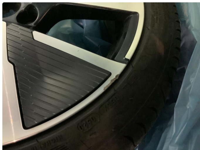
1.2 To sommer felger har mindre kant kjøring skade