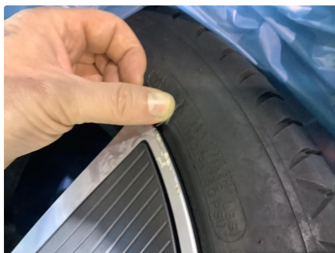
1.3 Liten rift i sommerdekk. Er godkjent, ikke skade inn til cord