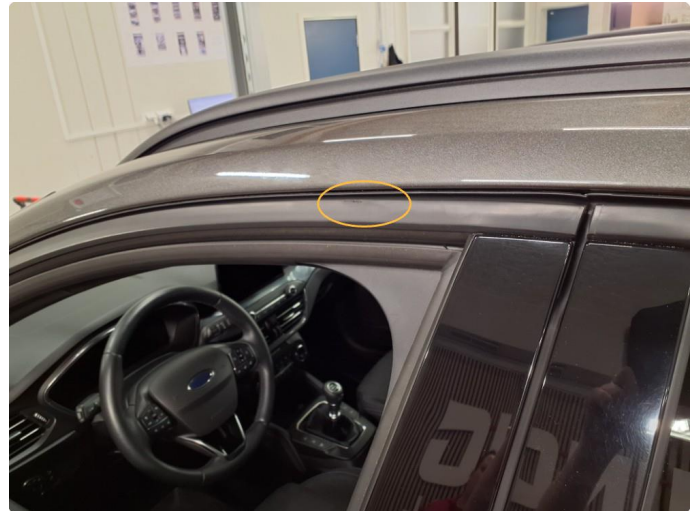
1.2 Liten skade list