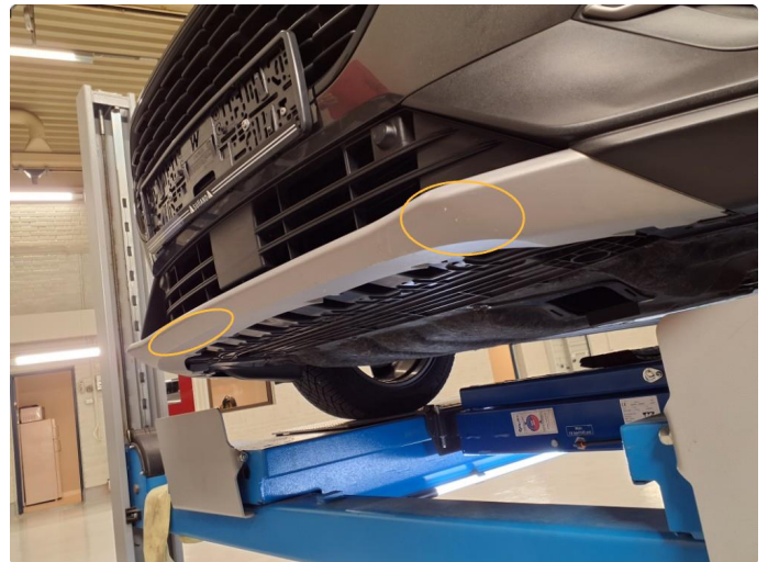
1.4 Riper Under på fanger