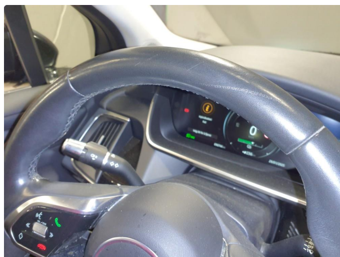
2.1 Noe bruksmerker