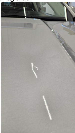
1.1 Noen Steinspruter på panser, som normalt ihht kilometer og alder