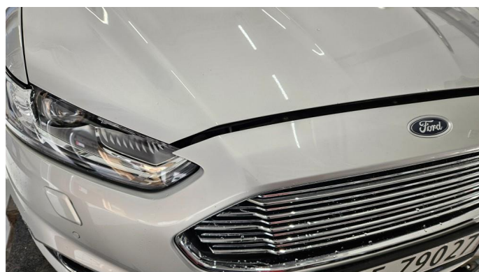
1.1 Noen Steinspruter på panser, som normalt ihht kilometer og alder