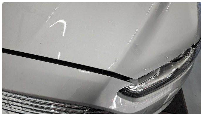
1.1 Noen Steinspruter på panser, som normalt ihht kilometer og alder