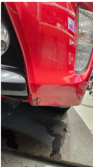
1.3 Striper under foran