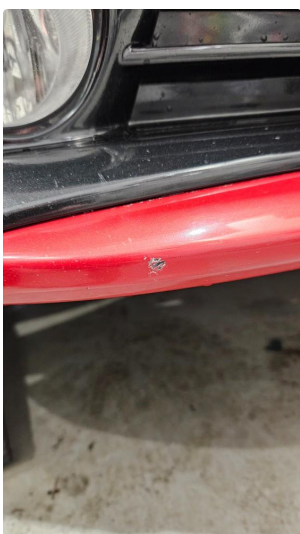
1.3 Striper under foran