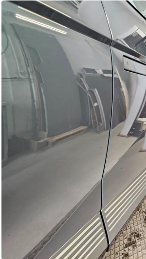
1.2 Liten bulk