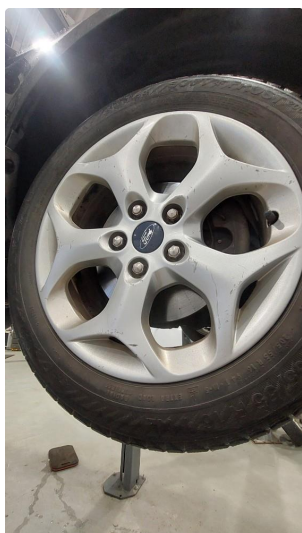
1.2 Ripe (r) gjennom lakk