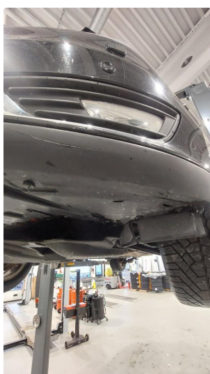
1.5 Skrubbskader underkant