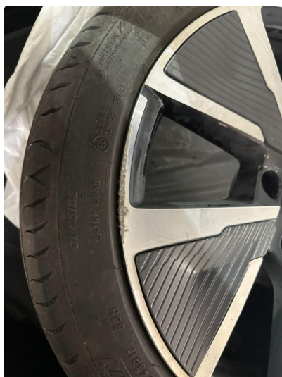
1.4 Kantkjørt felg Diamond Cut