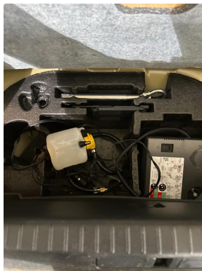
1.3 Dekktemiddel utgått/mangler