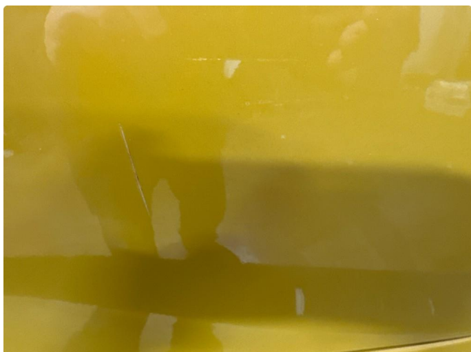
1.2 Ripe ned til grunning