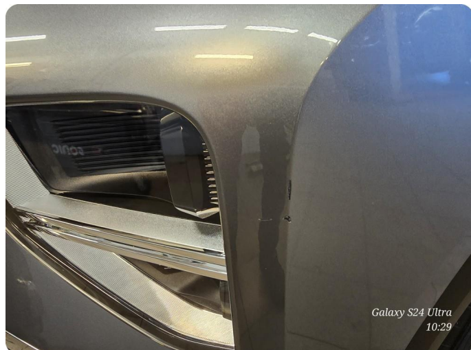
1.2 Skade Lakk pluss skade