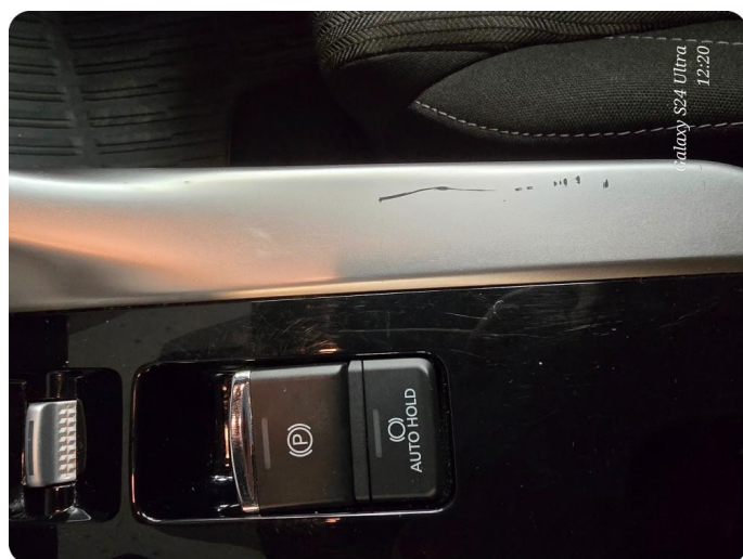
2.1 Funksjonsfeil på elektronisk parkbrems Parkering brems knapp/bryter. Dette er garanti.