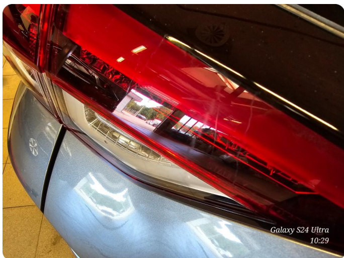
1.1 Ripe/lakk (halv del) Skade