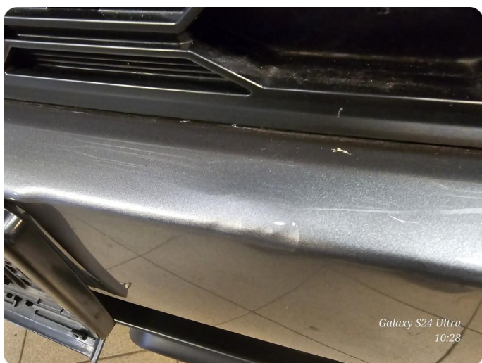
1.3 Bulk med lakkskade Riper også