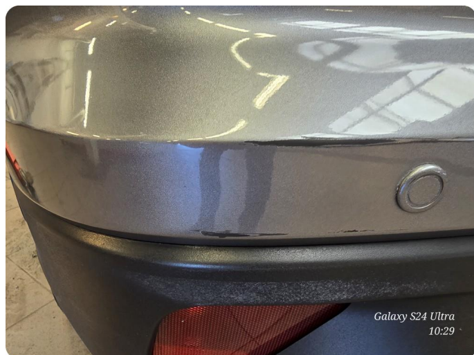
1.1 Ripe/lakk (halv del) Skade