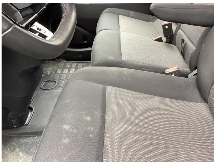
2.2 Innvendig vask