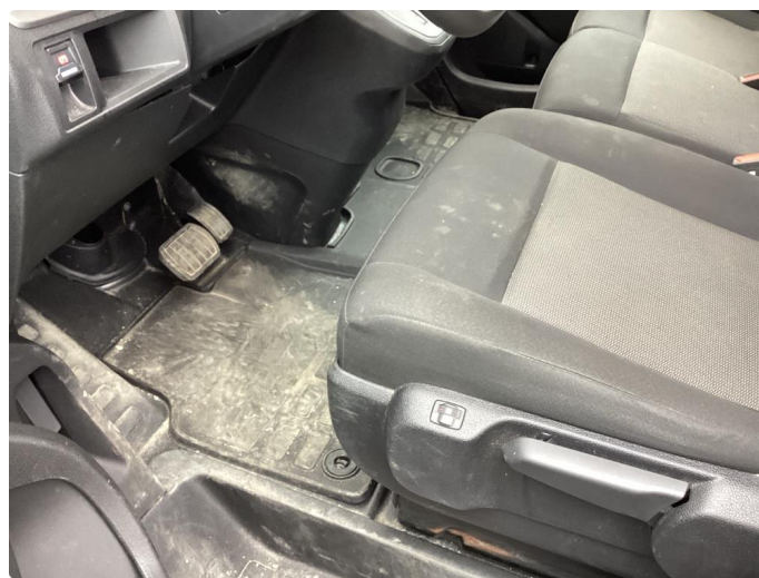
2.2 Innvendig vask