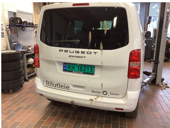
2.1 Fjerne dekor/logo