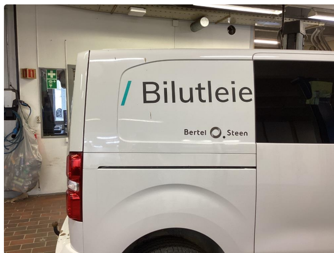
2.1 Fjerne dekor/logo