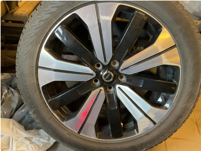
1.1 2 stk vinterfelger med merker på.