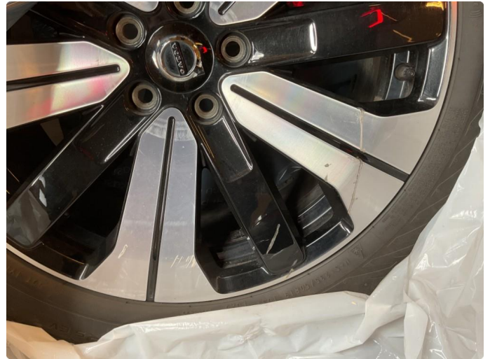
1.1 2 stk vinterfelger med merker på.