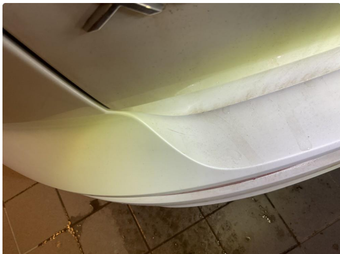
1.1 Lite merke på støtfanger bak