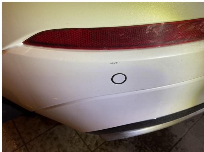
1.1 Lite merke på støtfanger bak