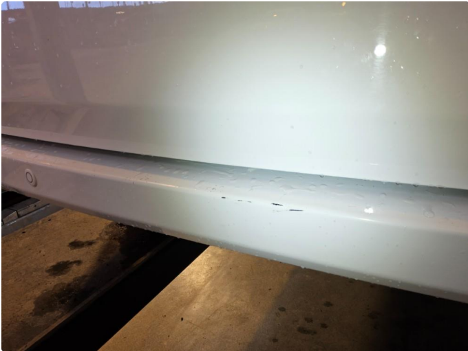
1.1 Småriper på støtfanger bak