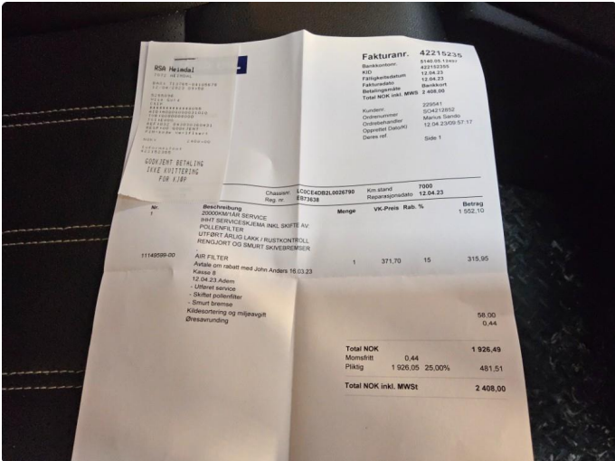
2.1 Dokumentert service, se bilde