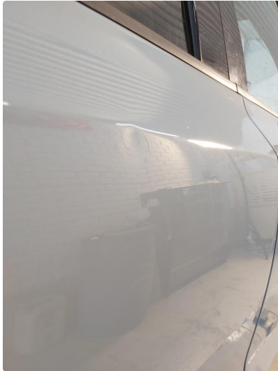
1.2 Liten bulk