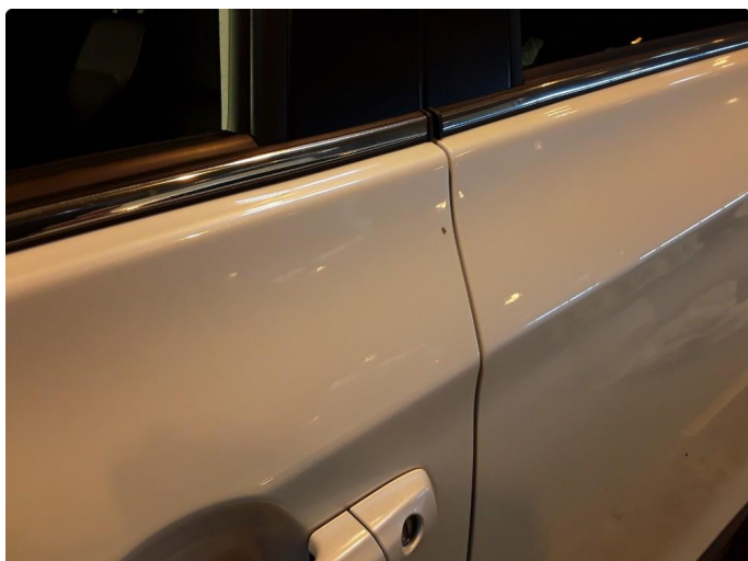
1.1 Noen striper