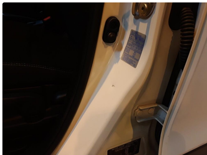
1.2 Noen riper og småbulker