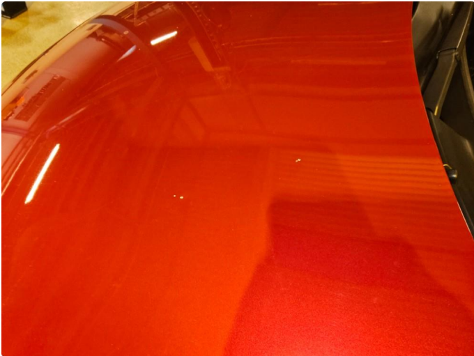
1.1 Noen steinsprut, ikke sjenerende