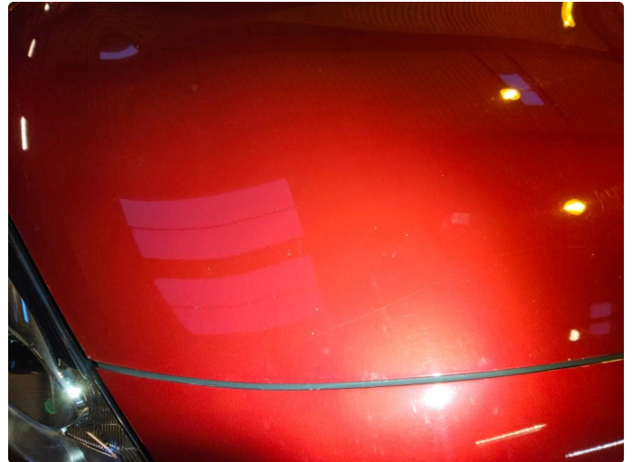
1.1 Noen steinsprut, ikke sjenerende