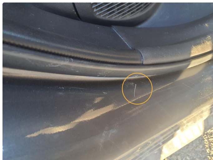
1.1 Riper og et par veldig små bulker