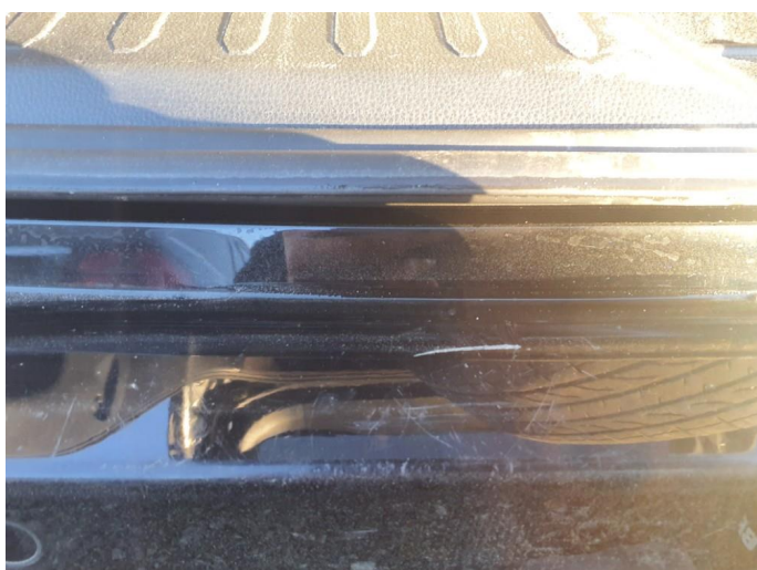
1.2 Små riper