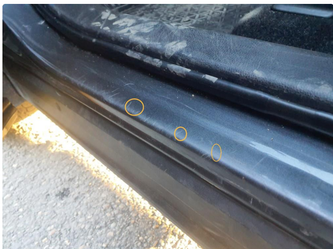
1.1 Riper og et par veldig små bulker