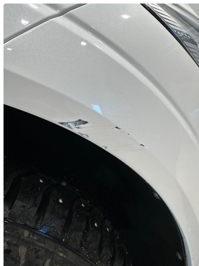
1.1 Skrubbskade høyre fordør og høyre bakdør