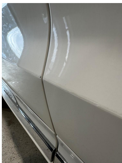
1.1 Skrubbskade høyre fordør og høyre bakdør