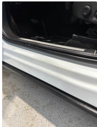
1.7 Noe riper i dørkarm