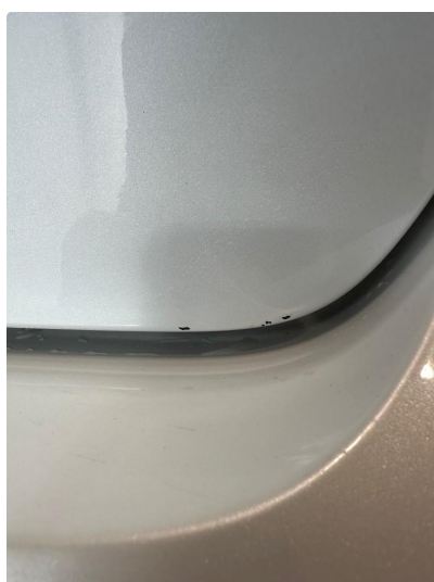
1.2 En del hakk og riper i bakluke