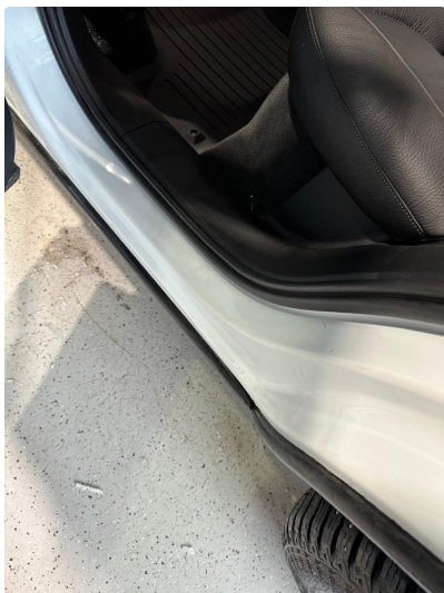
1.7 Noe riper i dørkarm