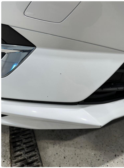
1.9 Steinsprut støtfanger foran