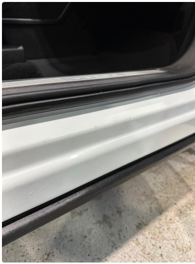
1.7 Noe riper i dørkarm