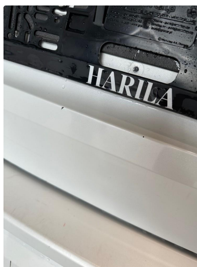
1.2 En del hakk og riper i bakluke