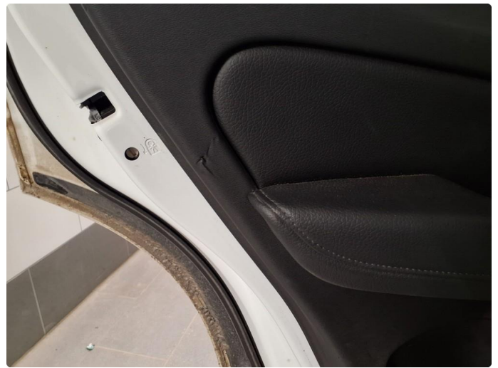
2.1 Små rifter i dørtrekk. Venstre foran og venstre bak.