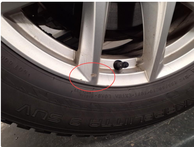
1.5 Kantkjørt felg