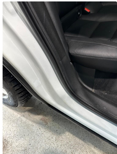
1.7 Noe riper i dørkarm