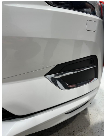
1.9 Steinsprut støtfanger foran