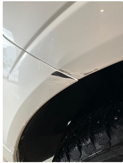
1.4 Skrubb skade skjerm