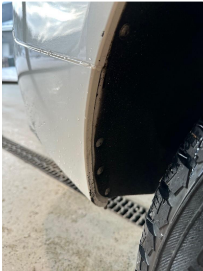
1.8 En del riper og hakk i støtfanger