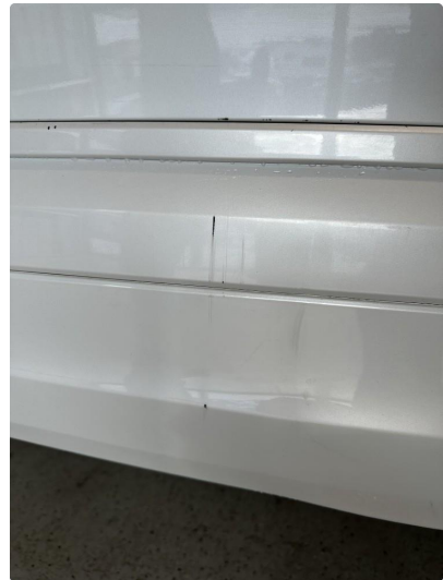
1.8 En del riper og hakk i støtfanger