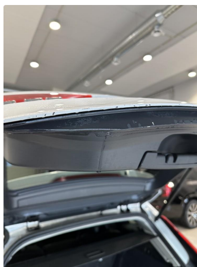
1.2 En del hakk og riper i bakluke