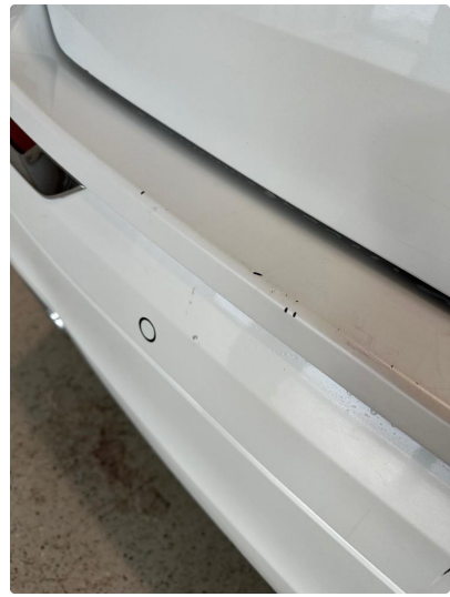
1.8 En del riper og hakk i støtfanger