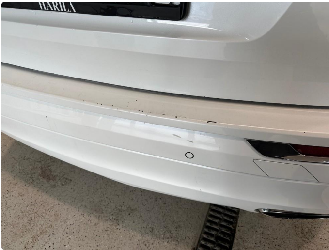
1.8 En del riper og hakk i støtfanger