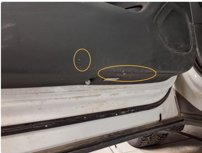
2.1 Små rifter i dørtrekk. Venstre foran og venstre bak.