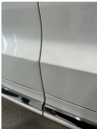
1.1 Skrubbskade høyre fordør og høyre bakdør