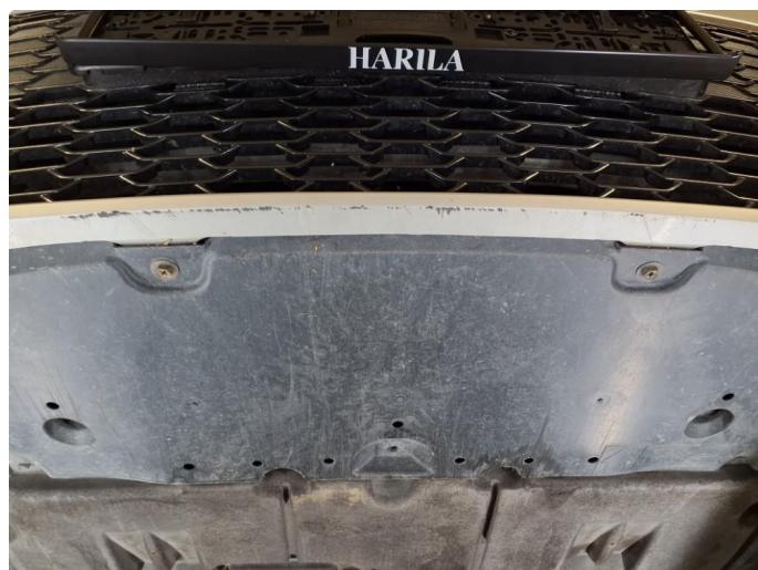
1.4 Skrubbskader underkant