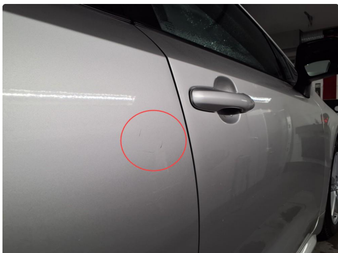
1.1 Ripe ned til grunning