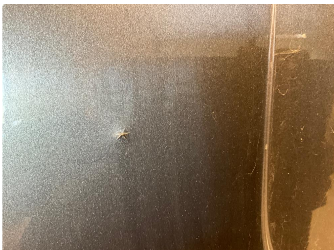
1.1 Utoverbulk på siden. Høyre bak.