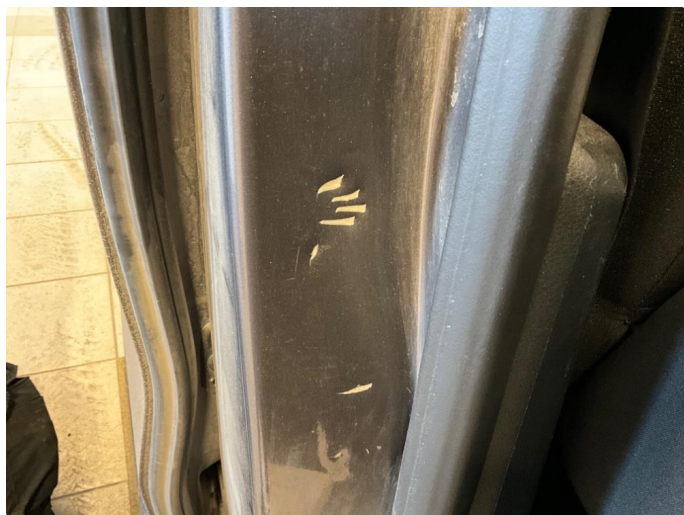
1.6 Bulk med lakkskade i døråpning.