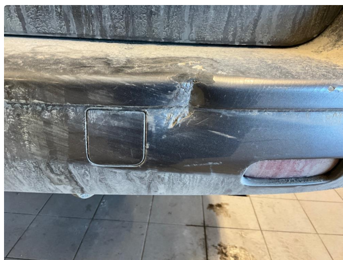
1.4 Bulk på støtfanger bak.