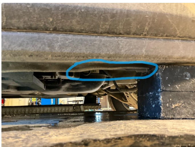
1.3 Jekkepunkter bak er litt bøyd.