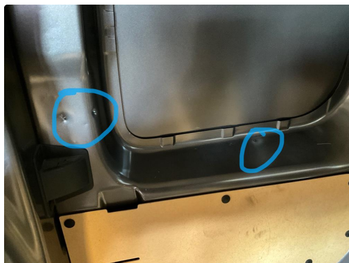
1.2 Generell bruksslitasje i varerom.