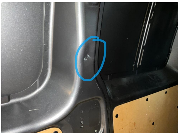
1.2 Generell bruksslitasje i varerom.