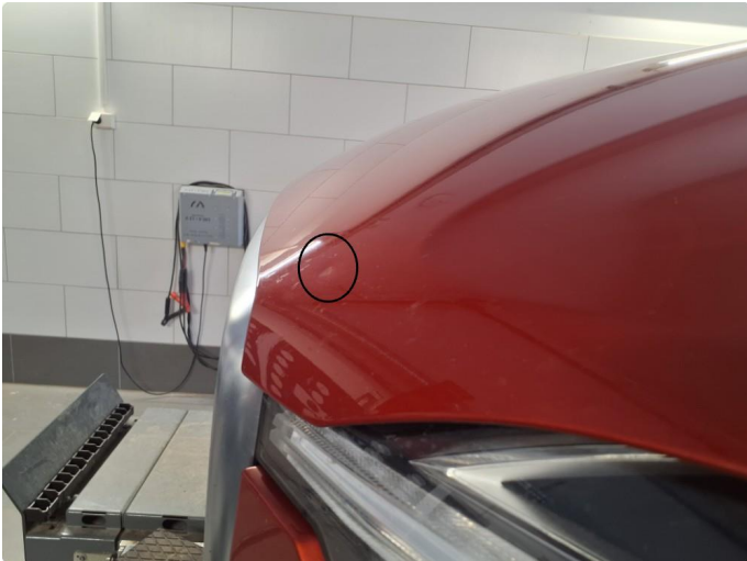
1.1 Liten bulk