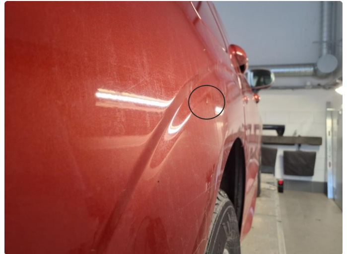
1.2 Liten bulk med lakkskade