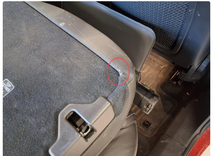
2.1 Skade på setetrekk