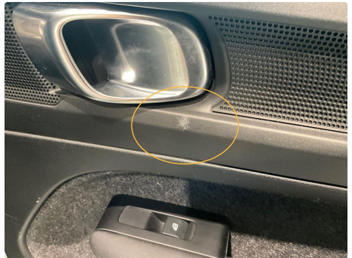
2.1 Slitasje under dørhåndtak.