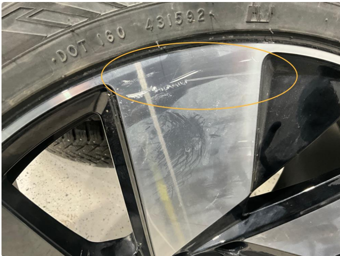
1.1 Kantkjørt felg. Vinter.