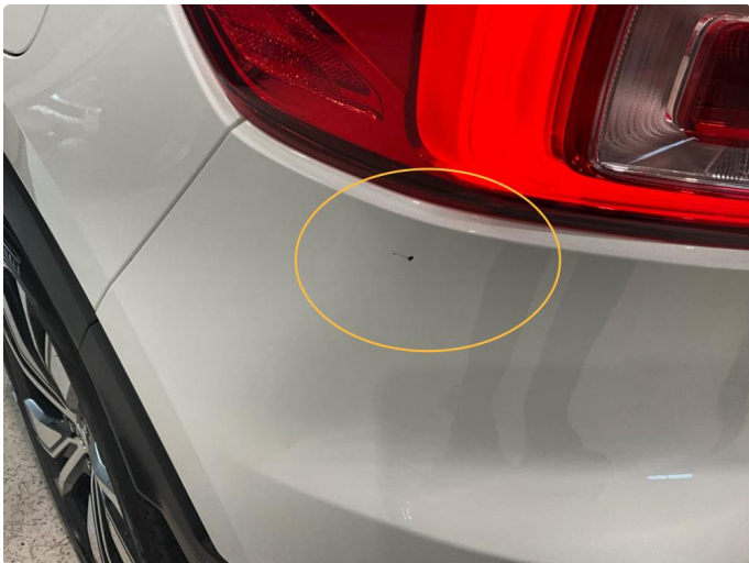
1.3 Lakkskade/ Steinsprut under lykt.