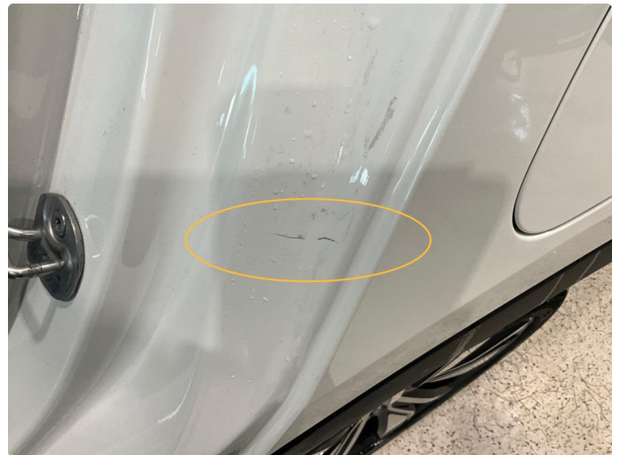
1.2 Neglefast ripe.