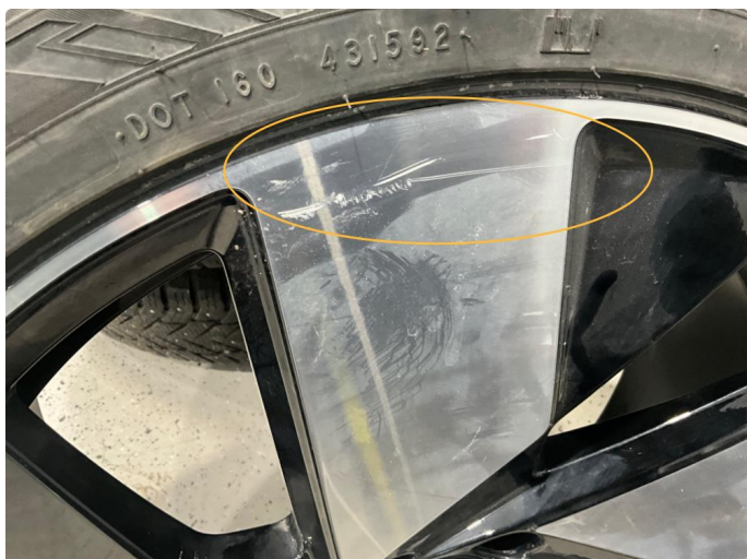
1.1 Kantkjørt felg. Vinter.