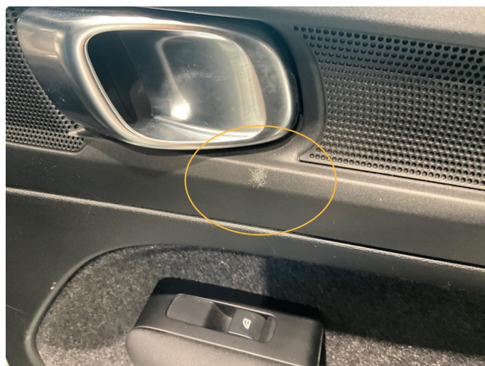
2.1 Slitasje under dørhåndtak.