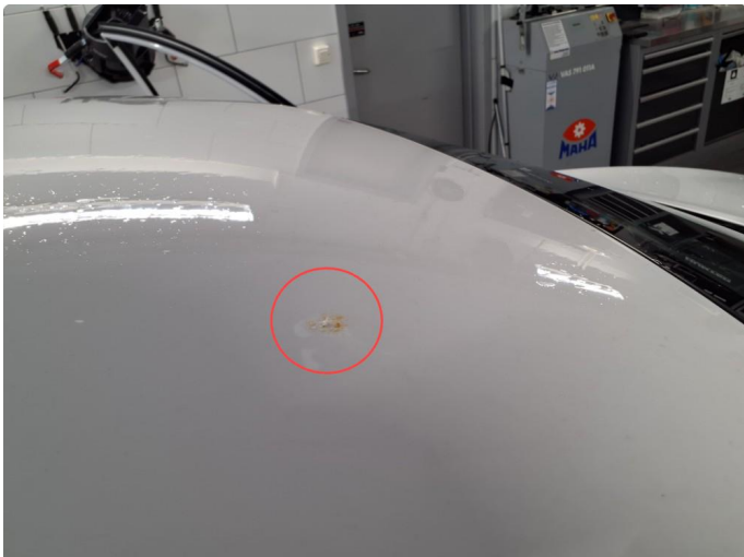
1.4 Rust flekk