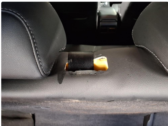
2.2 Deksel til seterygg mangler