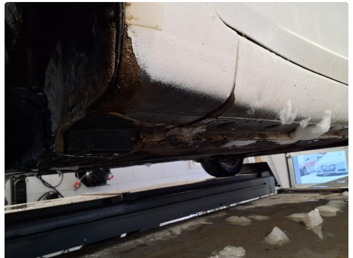
1.5 Korrosjon - rust