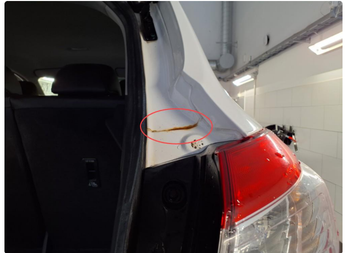
1.2 Rust i fals