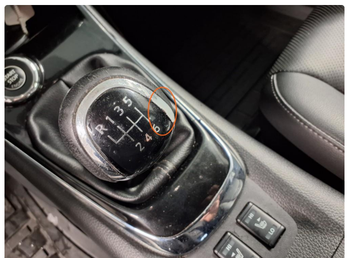
2.1 Bruksmerker - riper