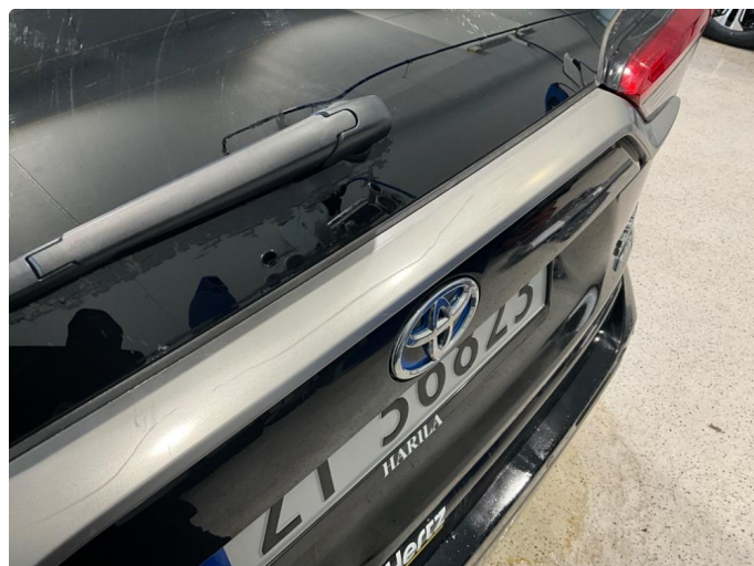
1.2 Lang ripe på pyntelist under bakrute.