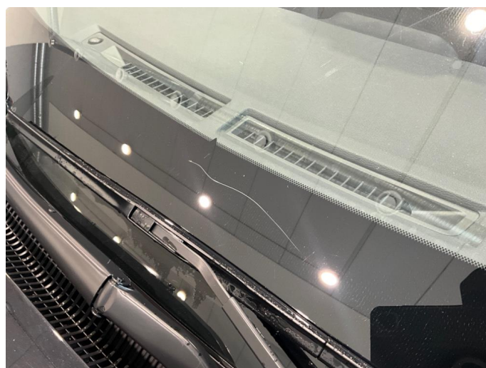
1.6 Ripe. Ikke i synsfelt.