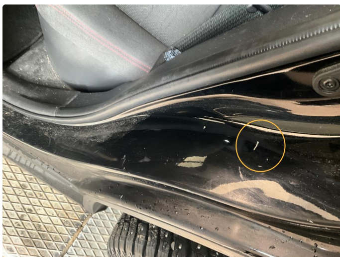
1.3 Riper og slitasje i døråpning.