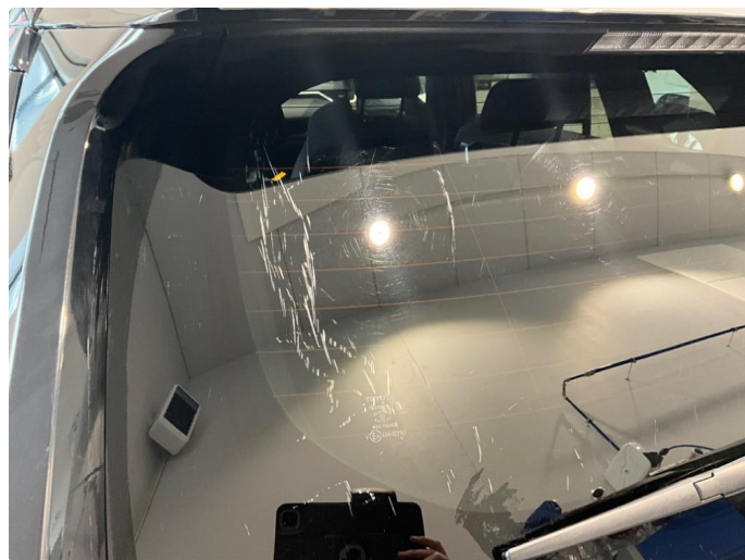
1.7 Noe slitt bakrute.