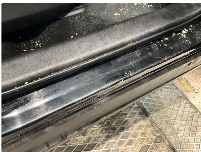
1.5 Slitasje på innsteg.