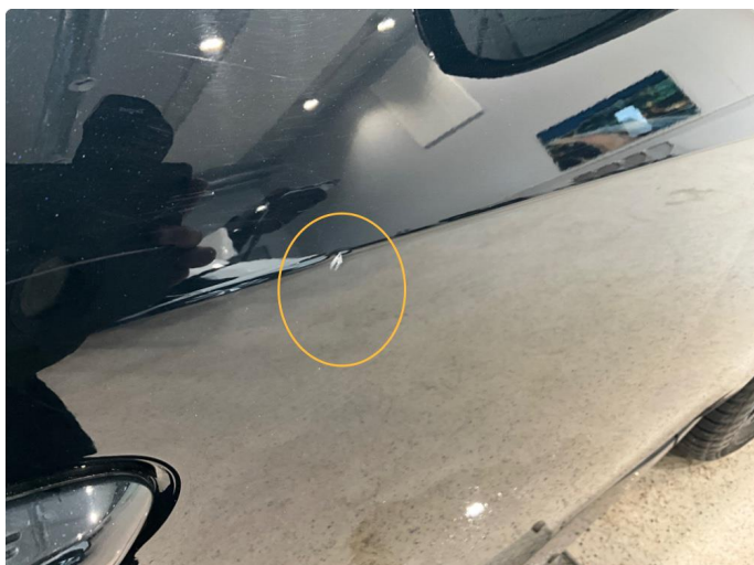
1.1 Liten bulk.