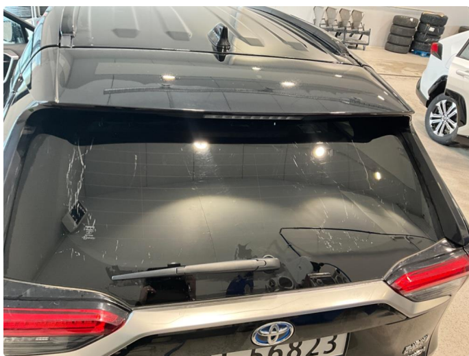
1.7 Noe slitt bakrute.