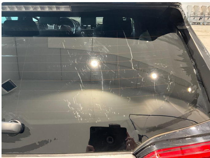
1.7 Noe slitt bakrute.