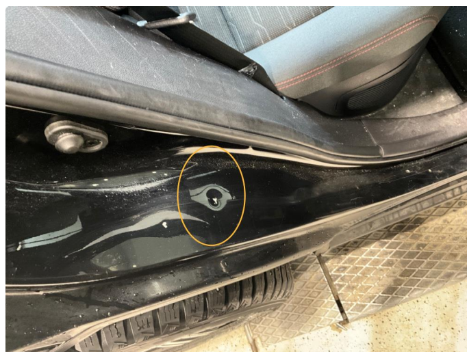
1.4 Bruksslitasje i døråpning. En bulk med lakkskade.