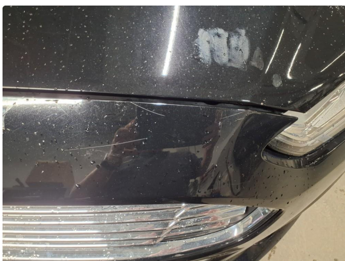
1.3 Riper på støtfanger, foran panser.