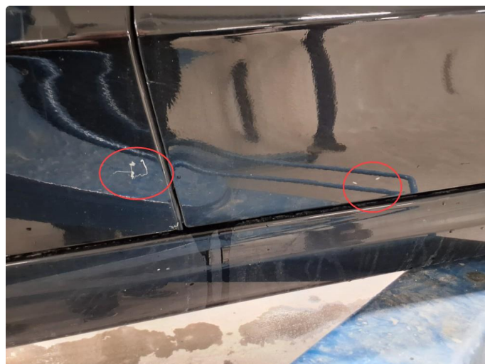
1.2 Noen dypere riper i nedre kant av fordør og bakdør. Passasjerside.