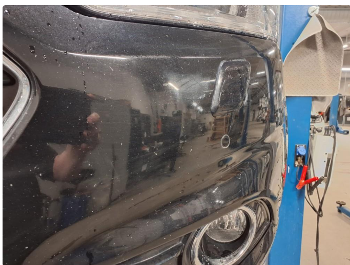
1.5 Steinsprut på støtfanger foran.