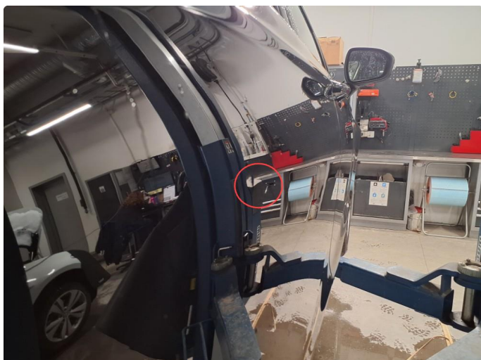
1.1 Svak bulk i dør.