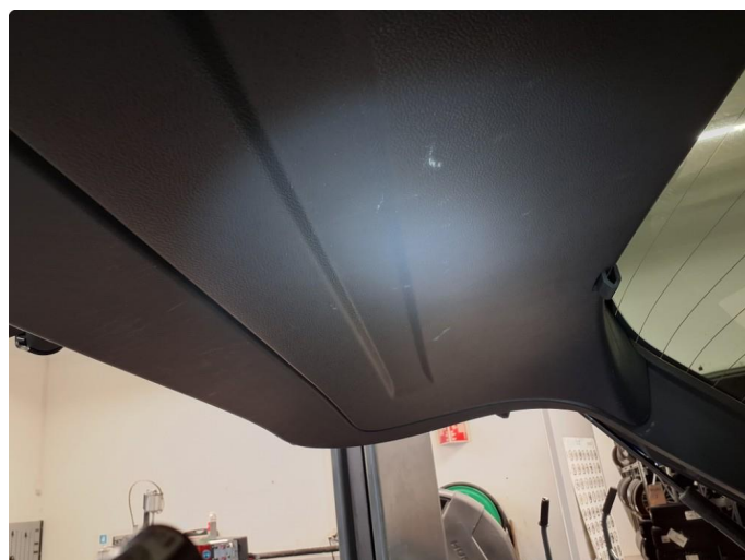
2.1 Merker etter utstyr