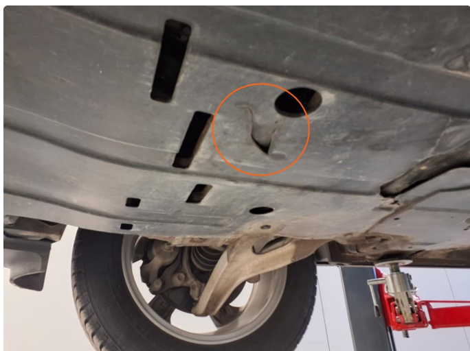
1.1 Beskyttelsesplate skadet