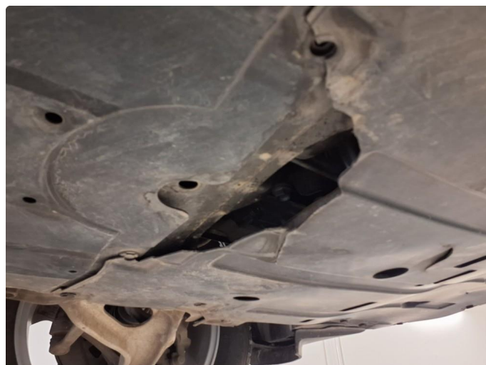
1.1 Beskyttelsesplate skadet