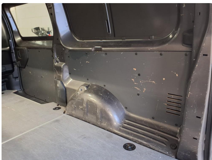
3.1 Generell bruks slitasje