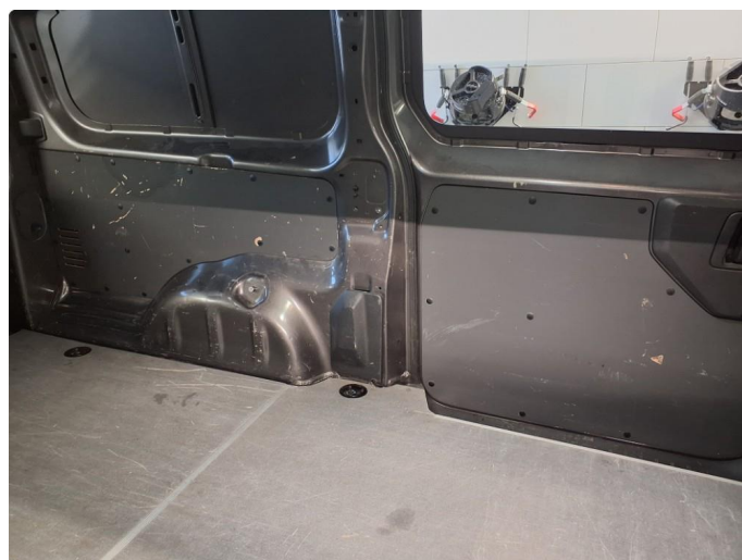
3.1 Generell bruks slitasje