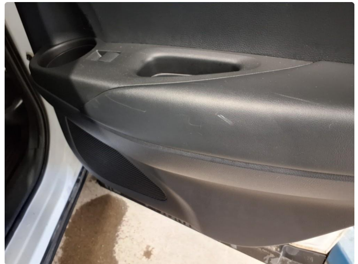
2.1 Merker etter utstyr