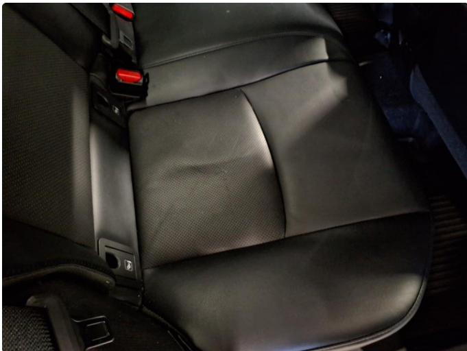
2.2 Bruksmerker på setetrekk